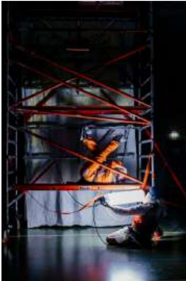
Polish Project